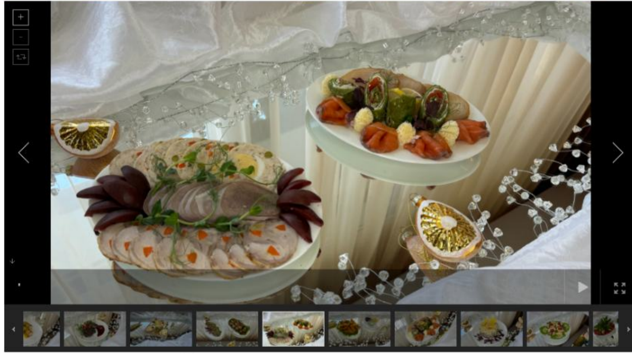
Схема расстановки столов

Количество мест ограничено. Будем рады встретить Новый Год вместе с Вами!