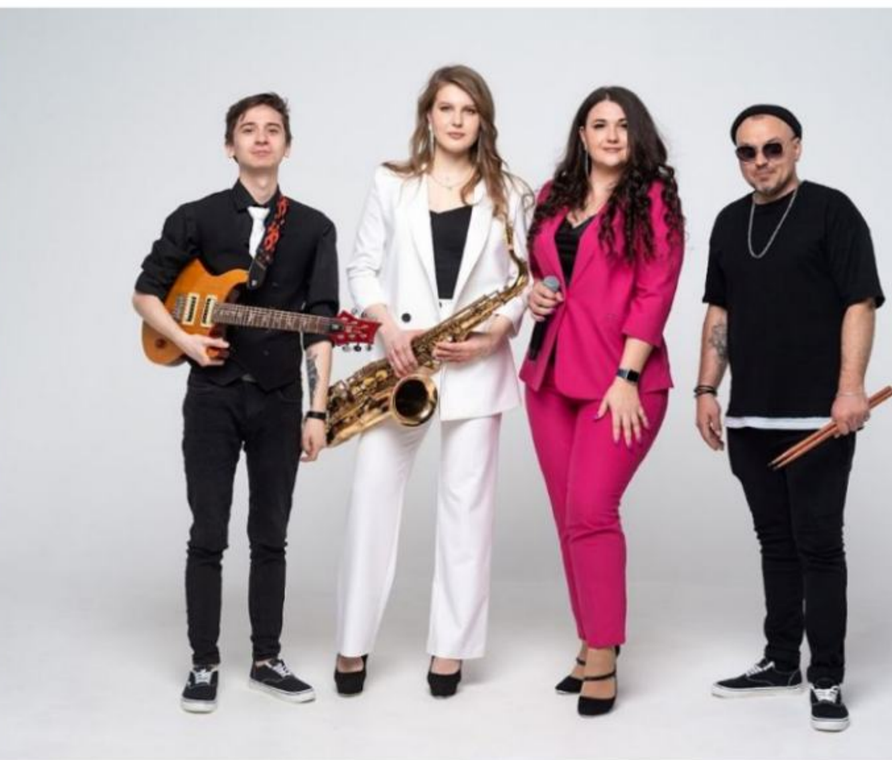
Войдем в Новый 2025г. на позитиве!

Новогодние каникулы в санатории «Кругозор» — это не только высококлассное лечение! Вас ждут - вкуснейшие блюда в современных обеденных залах, номерной фонд после реновации, потрясающие впечатления от города – курорта Кисловодска, культурно – досуговые мероприятия, прекрасная территория, где Вы сможете совершать прогулки, не покидая пределы нашего санатория!